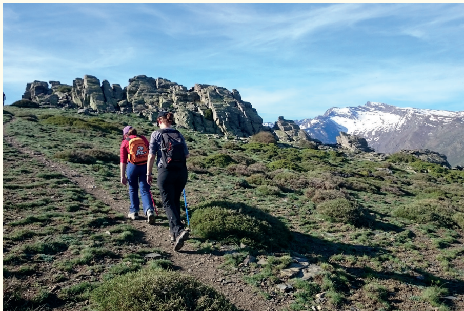
Senderistas en la ascensión de los Lavaderos de la Reina.

Nuestros resultados inciden en la importancia de las áreas protegidas, no solo desde el punto de vista de la conservación de la biodiversidad, sino como generadores de servicios ecosistémicos beneficiosos para la sociedad por su relevancia socioeconómica.